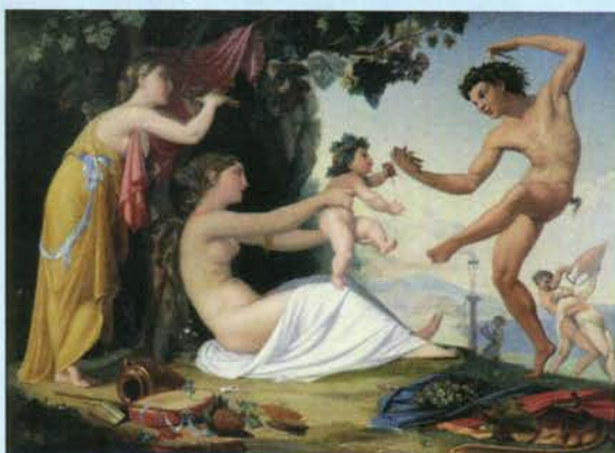
JEAN-ANTOINE-RAYMOND BALZE L'Éducation de Bacchus 1840, huile sur toile, 74,8 x 100 cm. Galerie Talabardon & Gautier, Paris.