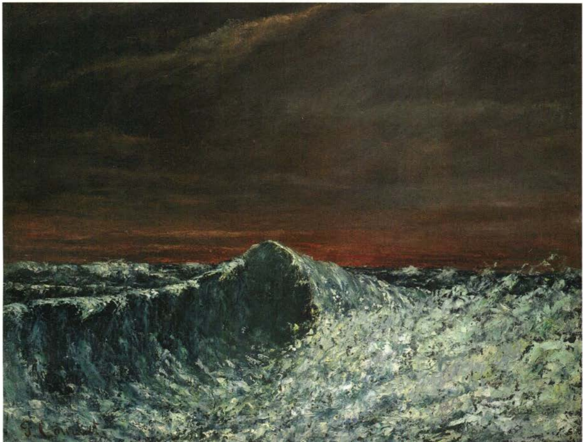
GUSTAVE COURBET La Vague 1872-1873, huile sur toile, 55 x 65,5 cm, Art Cuéllar-Nathan, Zurich. 900 000 €

Amateurs de peintures anciennes et conservateurs du monde entier sont attendus au palais Brongniart pour la 5 e édition de Paris Tableau. Un petit salon pour grands chefs-d'œuvre, du Moyen Âge jusqu'au début du XX e siècle.