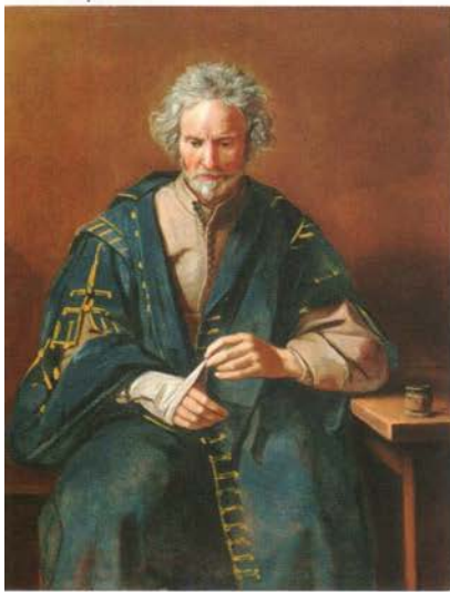
ANTONIO GIAROLA, DIT IL CAVALIER COPPA Le Toucher, l'Ouïe, la Vue, l'Odorat, le Goût 1660, huile sur toile, 120 x 100 cm (chacune).