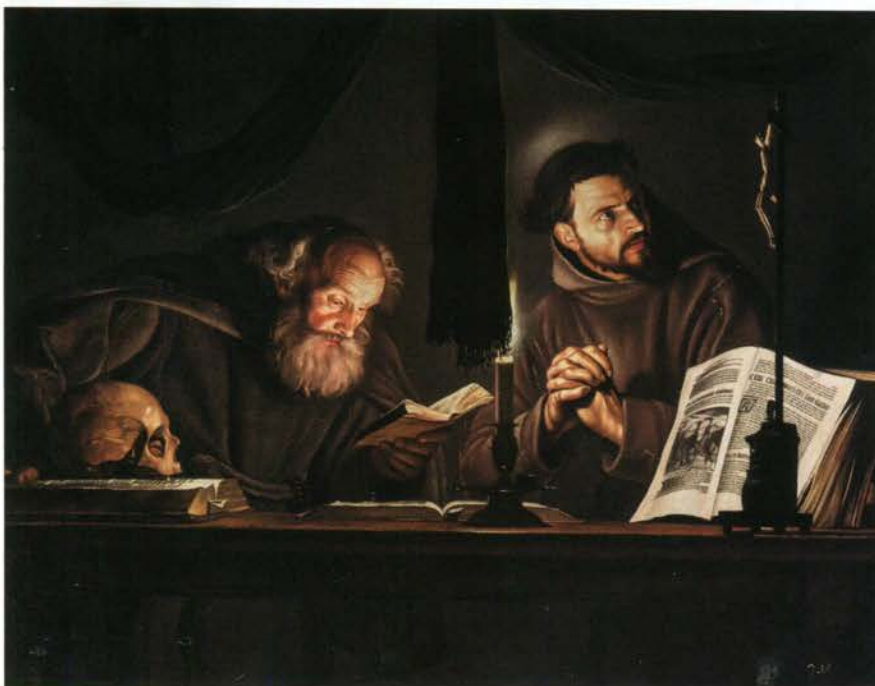
ADAM DE COSTER Saint François en méditation aux côtés du frère Léon Vers 1626, huile sur toile, 123 x 159,5 cm.

cialiste des maîtres italiens jusqu'au XVII e siècle ; Giacometti Old Master Paintings (Rome), très axé sur la peinture baroque italienne et Rob Smeets Old Master Paintings (Genève), concentré sur les œuvres néerlandaises, flamandes et italiennes des XV e et XVI e siècles. Dans un registre plus large allant du XV e au XX e siècle, l'antiquaire zurichois Arturo Cuéllar se présente aussi pour la première fois à Paris Tableau, en mettant en exergue une extraordinaire Vague déferlante de Courbet, s'élevant dans un ciel flamboyant au crépuscule, issue d'une célèbre série peinte vers 1869-1873. Spécialisée dans les peintures françaises impressionnistes, postimpressionnistes et modernes, la galerie londonienne Stoppenbach & Delestre fera son entrée avec une rare découverte de l'École de Pont-Aven : une vue panoramique de la campagne bretonne, les Chaumes en Guidel (1891) d'Henry Moret [ill. ci-dessus], qui fut largement influencé par son protecteur Paul Gauguin. Ravi de sa toute première participation l'an dernier avec notamment la vente de son tableau star, le Bain des chevaux du baron Gérard, la galerie londonienne Agnew's revient avec une sélection éclectique alléchante : un superbe Bouquet de fruits et de fleurs