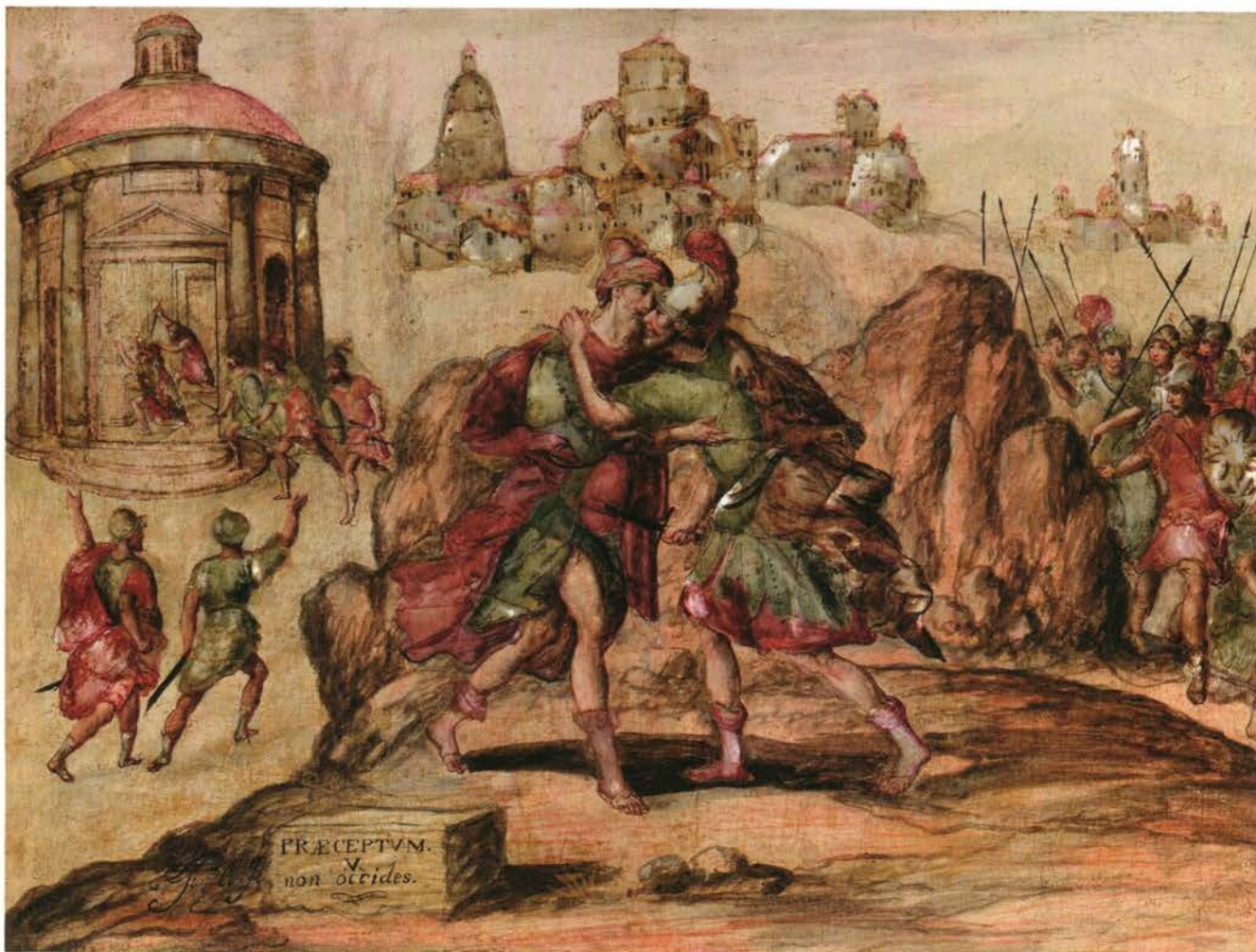
JUAN GONZALEZ DE MIER Le Cinquième Commandement: Tu ne tueras point ou La Mort d'Amasa Vers 1698, huile sur panneau avec incrustations de nacre, 44 x 60 cm. Galerie Terrades, Paris.