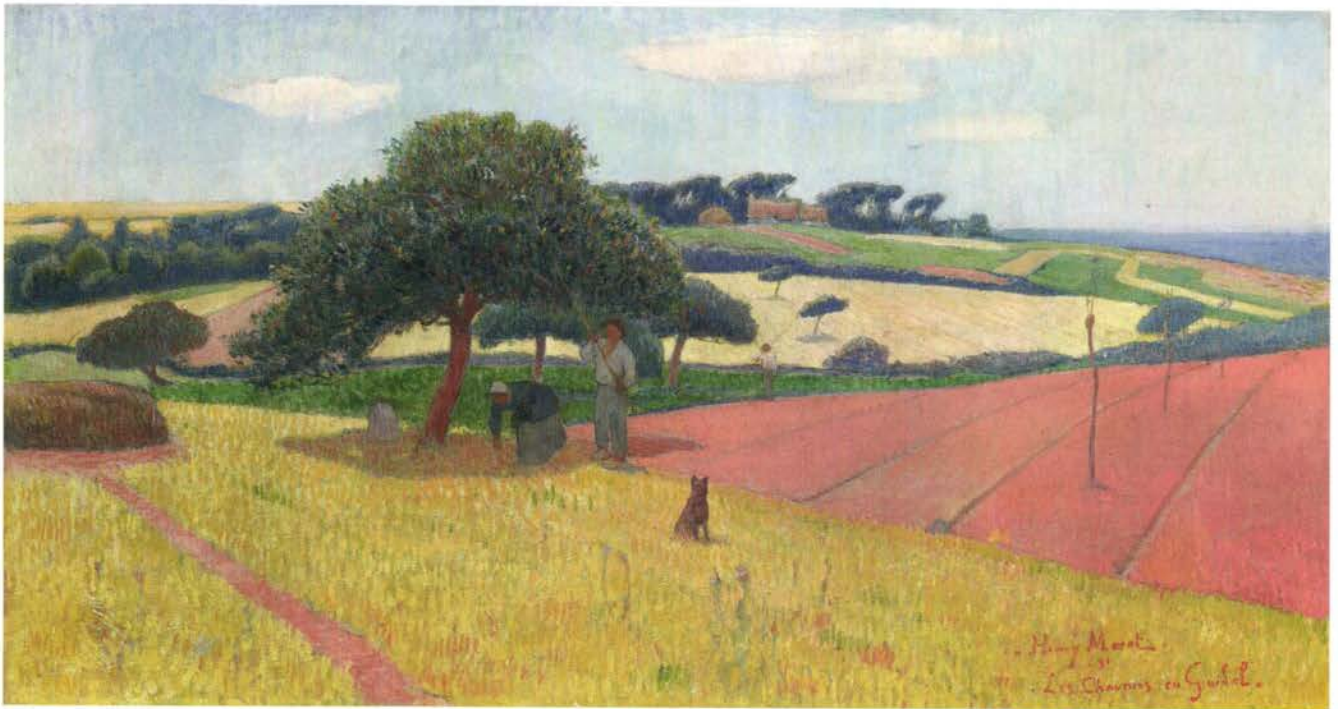
HENRY MORET Les Chaumes en Guidel 1891, huile sur toile, 55 x 100,5 cm. Stoppenbach & Delestre, Londres. 550 000 €

peinture vénitienne du XVI e siècle, en particulier Titien, et par son exécution, une veine classique qui a eu cours à Venise dans la suite de Padovanino (1588-1649), auprès duquel Carpioni a étudié au tournant des années 1630. C'est un tableau de la pleine lumière, dans des tons clairs qui font son charme». On pourra s'étonner de l'absence cette année de trois grandes peintures françaises du tableau